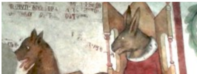
Affresco dal Castello di Valvasone (Pn)

Insieme Vocale H2VOX - % via G. Carducci 27 - 33074 Fontanafredda (PN)